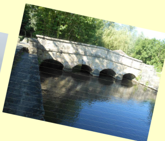
Le pont Romain