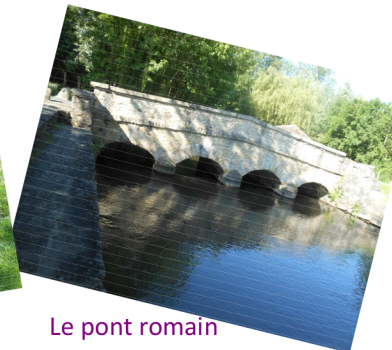
Le pont romain

1 Les planches : terrains plus long que larges, séparés par des petits fossés de drainage.