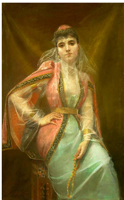
La Favorite ou Fiancée du sultan (1890) Pastel sur papier, présenté à Nice, 14 ème exposition Société des Beaux arts

Notre aimable voisine a repris ses pinceaux pour le salon d'Étampes avec une peinture à l'huile, Annamite, et de fort jolis pastels. Elle entend bien maintenant se consacrer le plus possible à son art favori. »