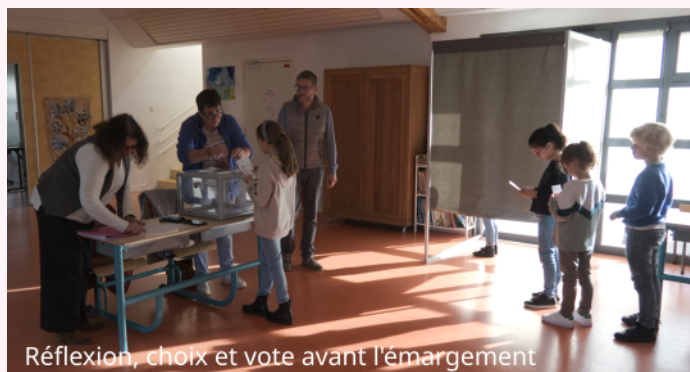
Réflexion, choix et vote avant l'émargement

La fin de l'année scolaire a marqué la clôture du mandat du CMJ 2020/2022, et donc une nouvelle équipe a été élue le 6 octobre dernier. Les douze jeunes candidats ont mené campagne au sein de leur classe avec leurs professions de foi, trames de leurs projets pour la commune.