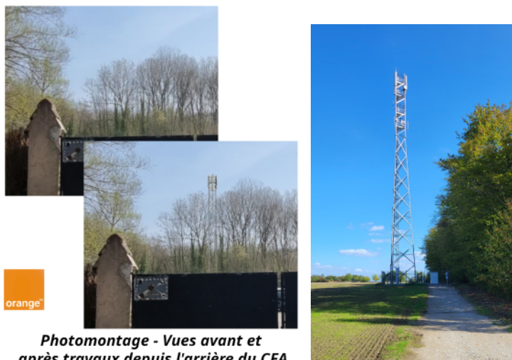
Photomontage - Vues avant et après travaux depuis l'arrière du CFA

En complément aux réponses apportées nos interlocuteurs nous ont fait parvenir une simulation visuelle depuis l'arrière du CFA ainsi que la photo d'un pylône similaire à celui prévu à Ormoy-la-Rivière :