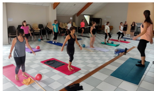
Avant l'assemblée générale, un cours commun à toutes les sections était organisé.

Les adhérents sont invités à une randonnée, le 6 septembre de 18 h 30 à 20 h 30, qui sera suivie d'un petit repas offert par l'association.